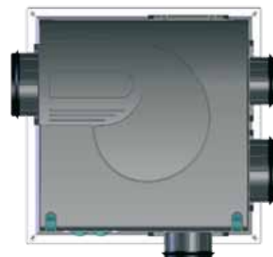
Индивидуальный вентилятор с низким уровнем собственного шума

По классификации СНиП 23-02-2003 «Тепловая защита зданий», табл.3, класс энергетической эффективности такого здания считается «высоким» и для него органам администрации субъектов РФ рекомендуется обеспечить экономическое стимулирование.