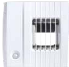
Многофункциональное вытяжное устройство.