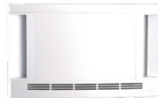
Стеновое гигрорегулируемое приточное устройство.

Компания Aereco предлагает комплексное решение вопросов комфорта и снижения эксплуатационных расходов путем создания в жилых домах саморегулирующихся автоматических вентиляционных систем с технологией гигрорегулирования (управление воздухообменом по уровню влажности внутреннего воздуха и присутствию жильцов). Энергосберегающий эффект обеспечивается путем автоматического снижения нормативного воздухообмена во временно пустующих помещениях. Технологически установка энергоэффективной вентиляционной системы сводится к монтажу приточных шумозащитных оконных или стеновых устройств в жилых комнатах (спальнях и гостиных), установке автоматических вытяжных решеток на кухнях, в ваннах и туалетах, реагирующих на изменение влажности воздуха и/или присутствие человека, и установке индивидуальных механических вытяжных вентиляторов в квартире или вентиляторов общего пользования на крыше/чердаке.